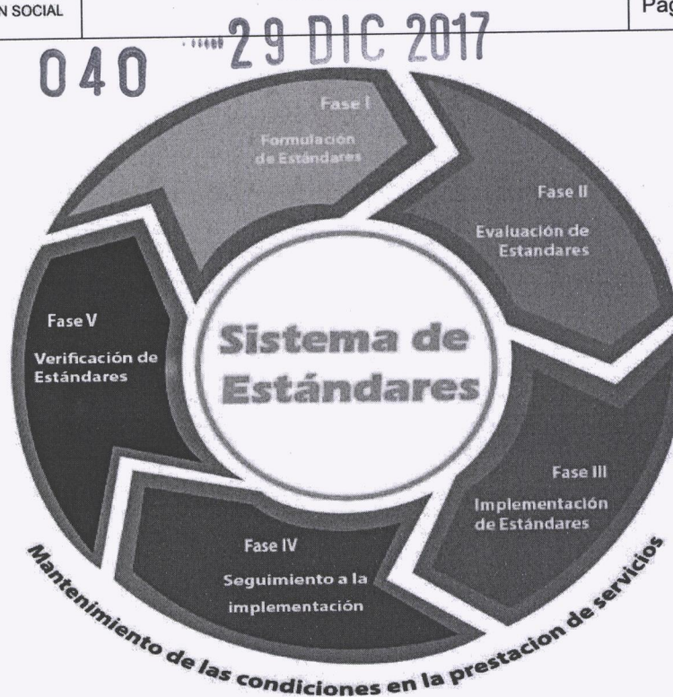
Fig. 2 Sistema de estándares de calidad de los servicios sociales

Fase I. Formulación de estándares: consiste en la definición de los requisitos mínimos o esenciales de calidad de los servicios sociales acorde con las necesidades, expectativas y derechos de la población objeto en el marco de la Política Social y la normatividad vigente aplicable, para ello, es necesario contar con una serie de insumos como los requisitos legales y normativos, el modelo del servicio social y las referencias internacionales o de otros sectores, si existen. Para la formulación de estándares la Secretaria Distrital de Integración Social ha diseñado una metodología orientada a la identificación de los atributos y características de los servicios con el fin de establecer cuáles son las condiciones esenciales para la prestación del servicio social con calidad, así mismo, identificar cuáles son las acciones, procedimientos y protocolos que se desarrollan y cuáles son las evidencias de su cumplimiento con miras a la verificación de los mismos.